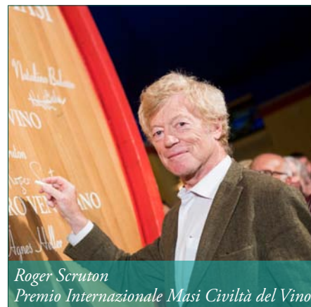
Roger Scruton Premio Internazionale Masi Civiltà del Vino