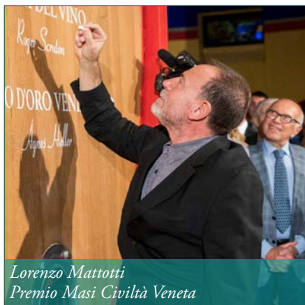
Lorenzo Mattotti Premio Masi Civiltà Veneta